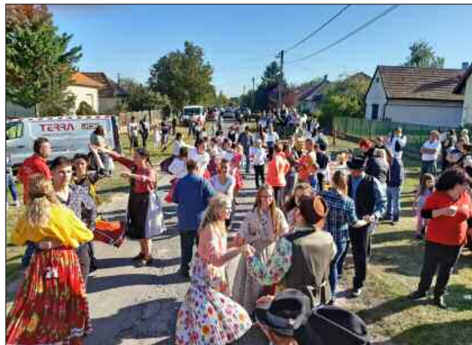
A képen egy különleges esemény: (terheléspróba) a szüreti menet próbálja ki az új helyszínen a búcsú szórakoztató eszközeit