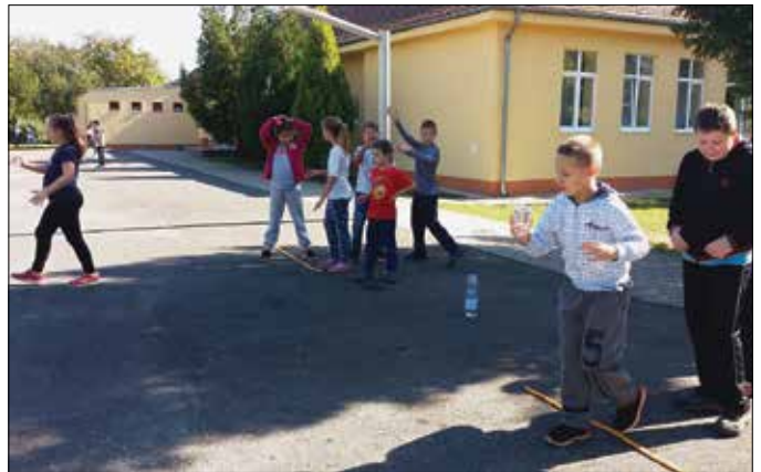
Sport játékosan, vegyes csapatokban