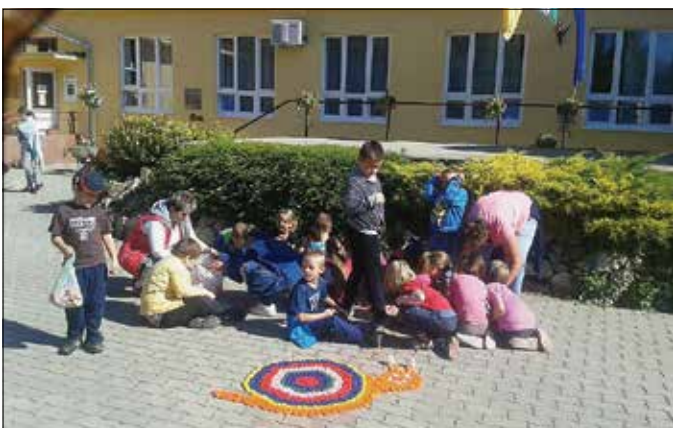
A közösen készített alkotás