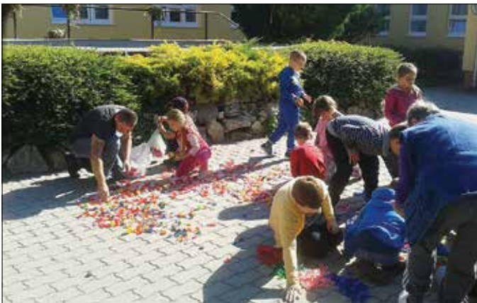
Válogatás a kupakokból